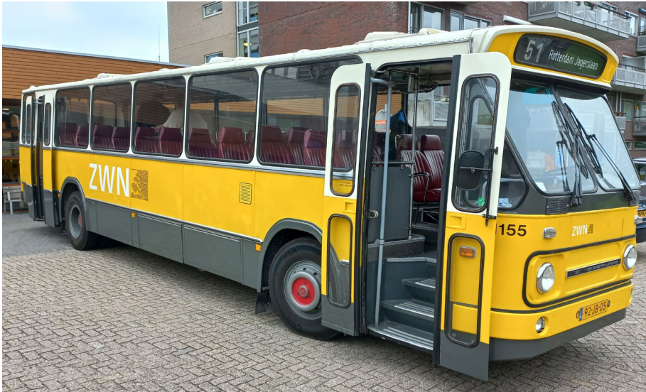
foto: een van de iconische bussen die door de Woerdense Bussenbouwer werd vervaardigd

Voormalige Woerdense bussebouwer Den Oudsten stond in het kader van Open Monumentendag op zondag 15 september in de spotlights tijdens een herdenkingsmiddag in de hal van zorgcentrum Careyn Weddesteyn in Woerden.