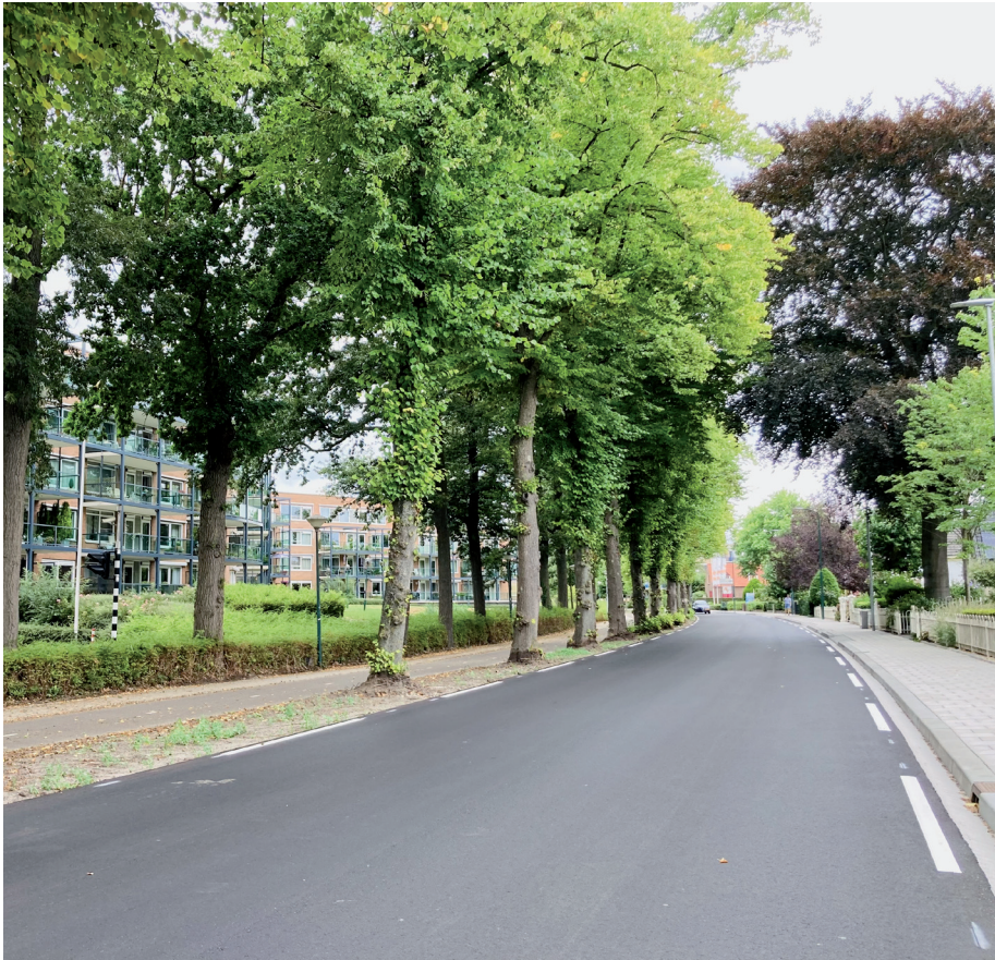
foto: een prachtig nieuw wegdek op de Oudelandseweg. Helaas wel zonder zebrapad.

De Oudelandseweg is onlangs opgeknapt en menig automobilist zal daar blij om zijn. Er ligt strak asfalt en dat nodigt uit tot het verder indrukken van het gaspedaal. Dit tot ergernis van de bewoners van de 130 appartementen, die uitkijken op de Oudelandseweg. Bewoners hadden zich sterk gemaakt om van de weg een 30 km weg